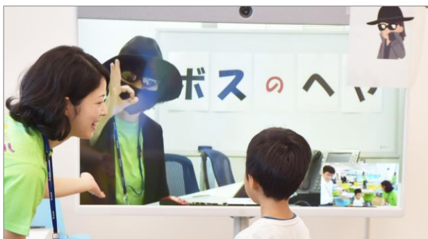
<お仕事インタビュー>