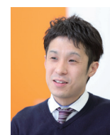
朝日インタラクティブ株式会社 技術部 ディレクター 兼 シニアマネージャー