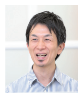
朝日インタラクティブ株式会社 技術部 サブマネージャー